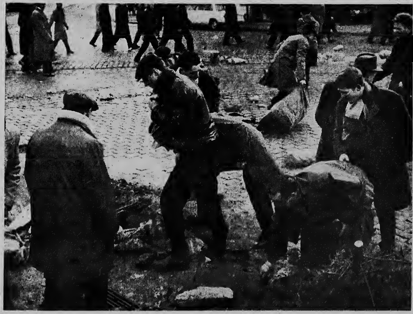
WELGA NA BELGICA. — Un bista riba Antwerpen na Belgica. Welgistanan tabata aqui na accion sin tene cuenta cu nan destino. Danki Dios cu probablemente awe tur welga lo termina na Belgica.